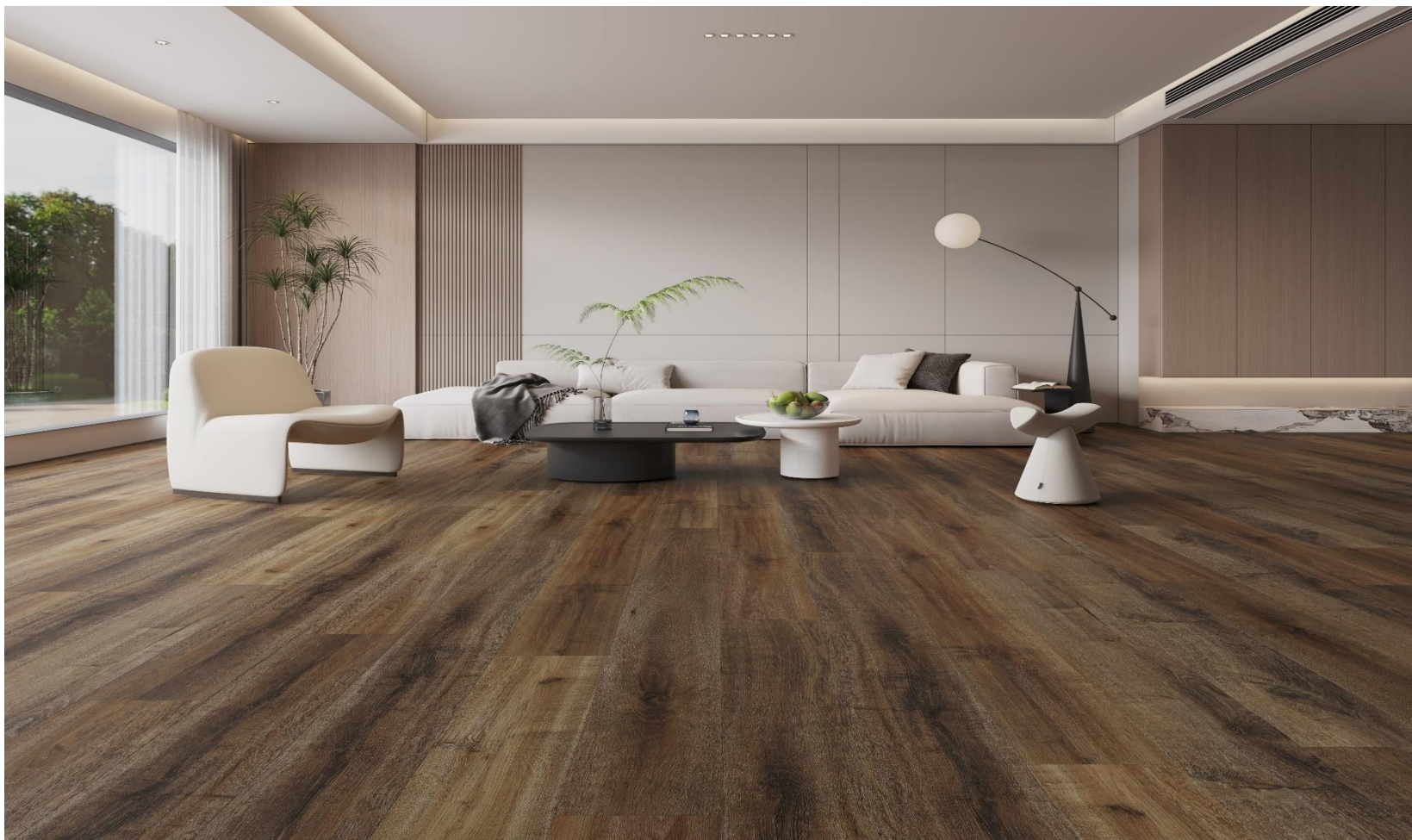
ROMA DARK BROWN SPC – MICROBISEL – N | PDV-20-0710