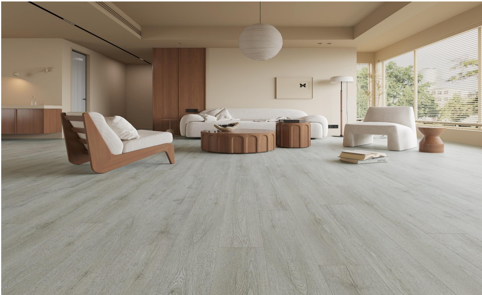
ROMA GREY SPC – MICROBISEL – N | PDV-20-0707