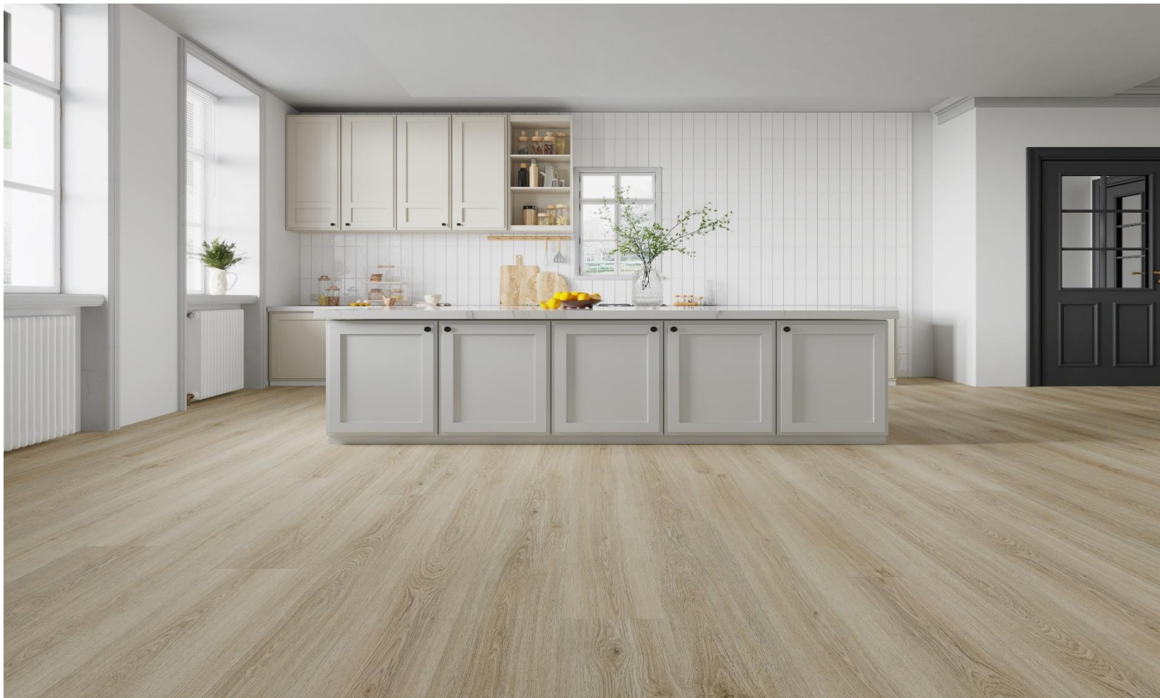
ROMA BEIGE SPC - MICROISEL – N | PDV-20-0708