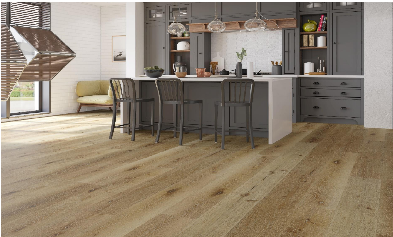
ROMA LATTE SPC – MICROBISEL – N | PDV-20-0709