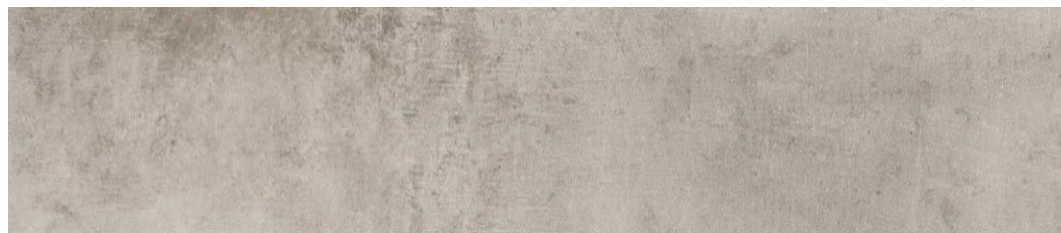
PDV-20-0091 | FLOW GREIGE SPC 229x1220MM