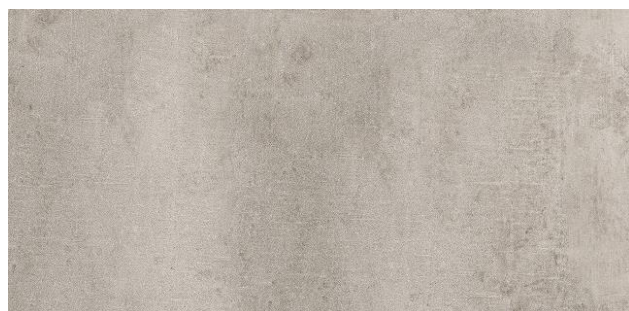
PDV-20-0089 | FLOW GREIGE SPC 305x610MM