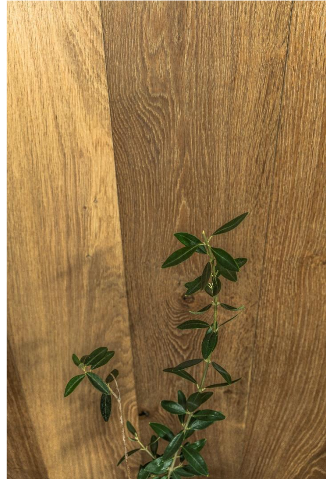
CARVALHO BEATRICE RUSTIC | NTF-19-002