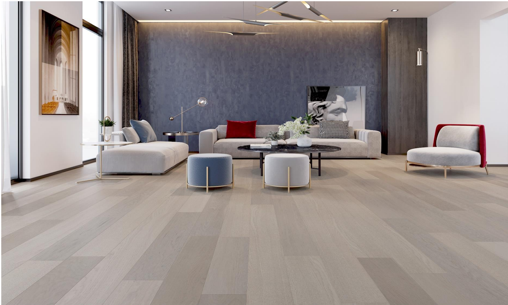
HIMALAYA OAK KRABI | KLM-19-0133