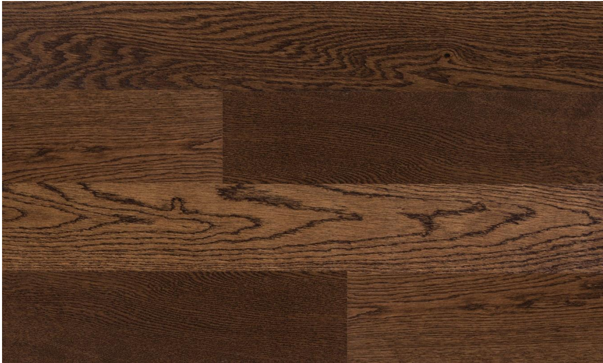
HIMLAYA OAK OLIVE KLM-19-0053