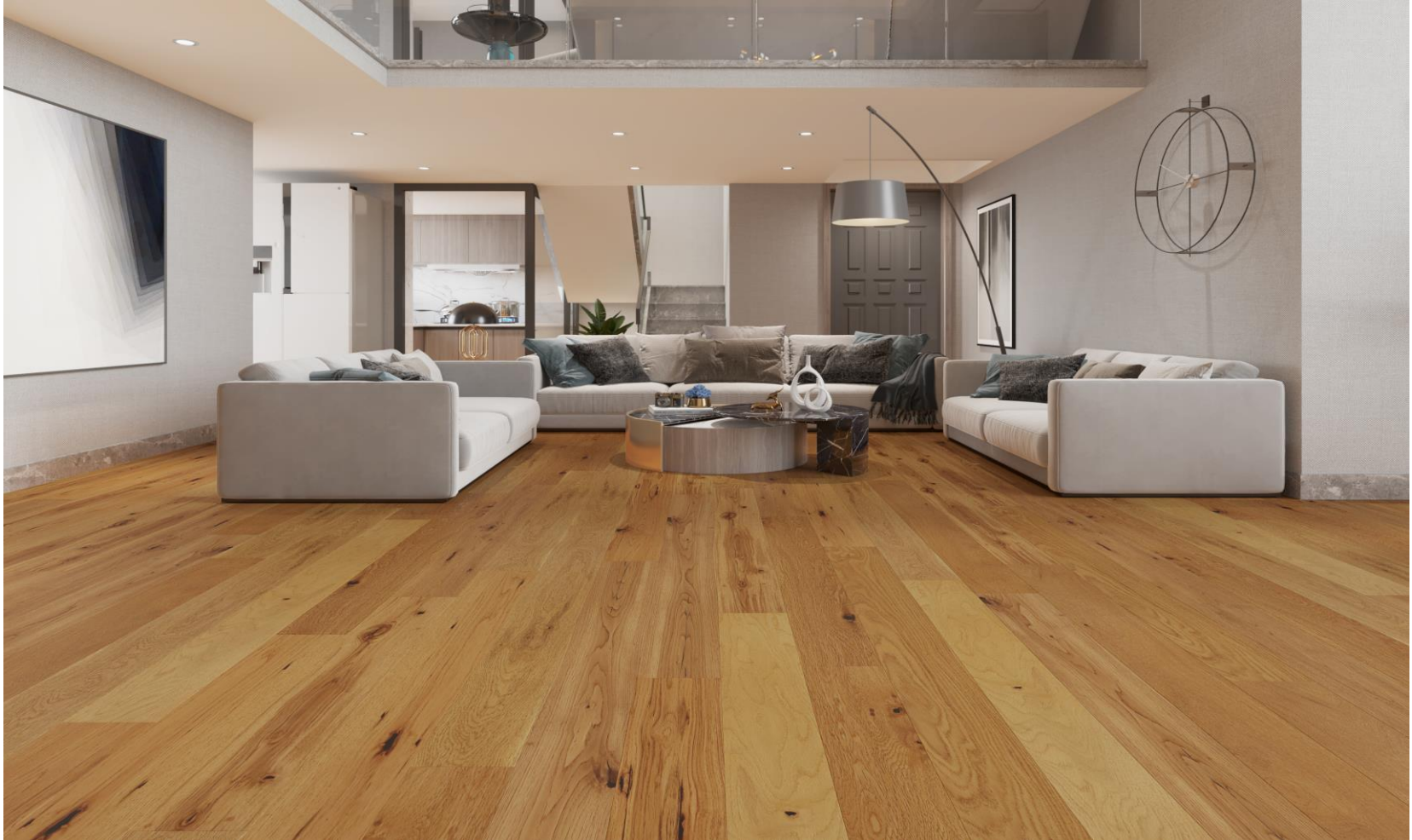
HIMALAYA OAK NATURAL | KLM-19-0231