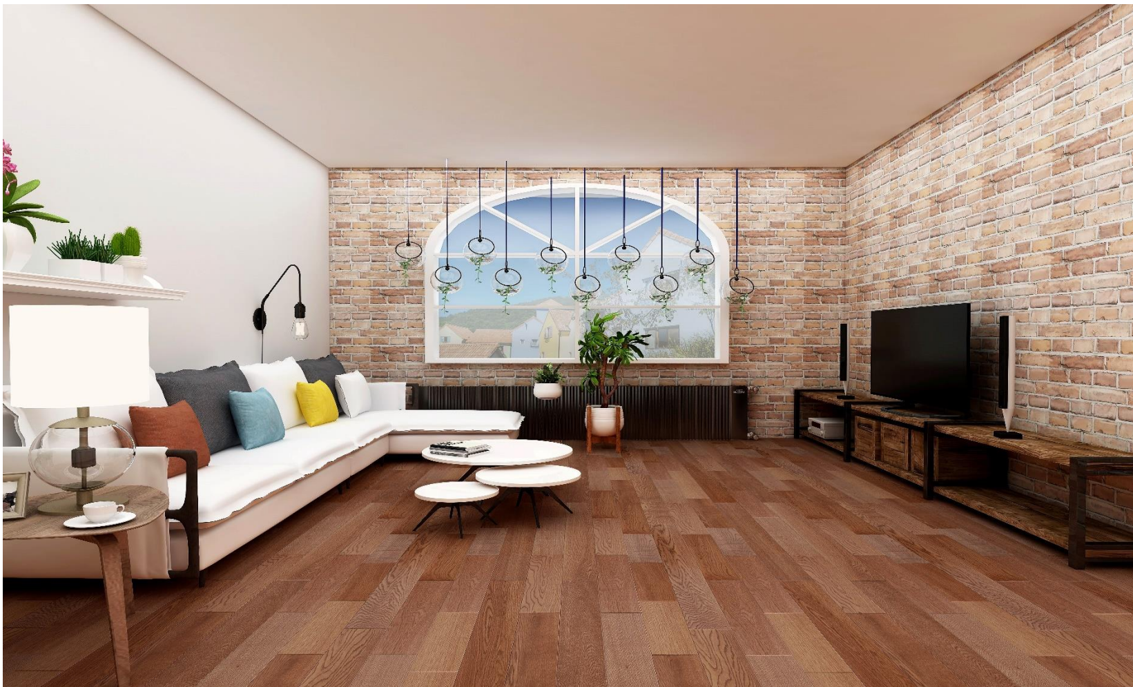
HIMALAYA OAK OLIVE | KLM-19-0053