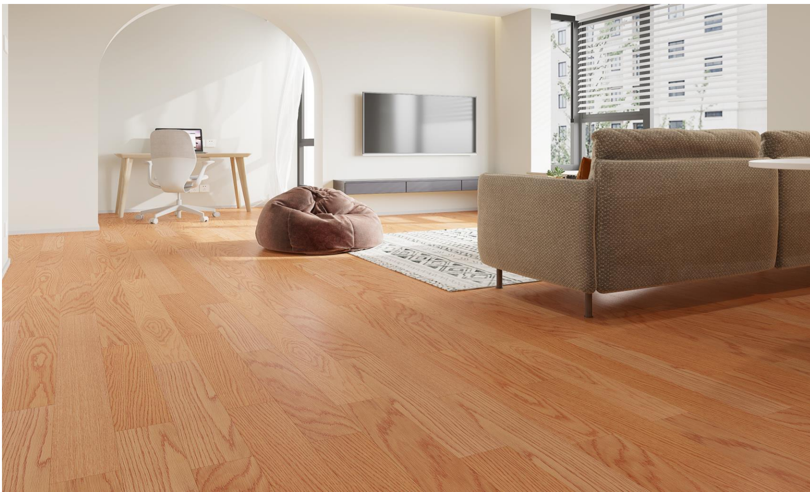
HIMALAYA OAK LIME | KLM-19-0051