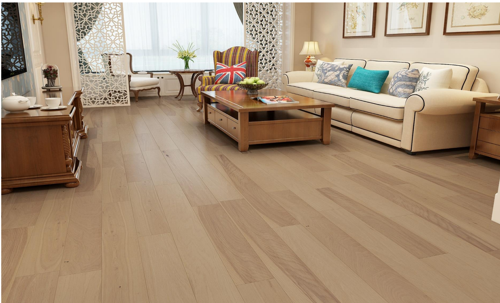
HIMALAYA OAK BALI | KLM-19-0089