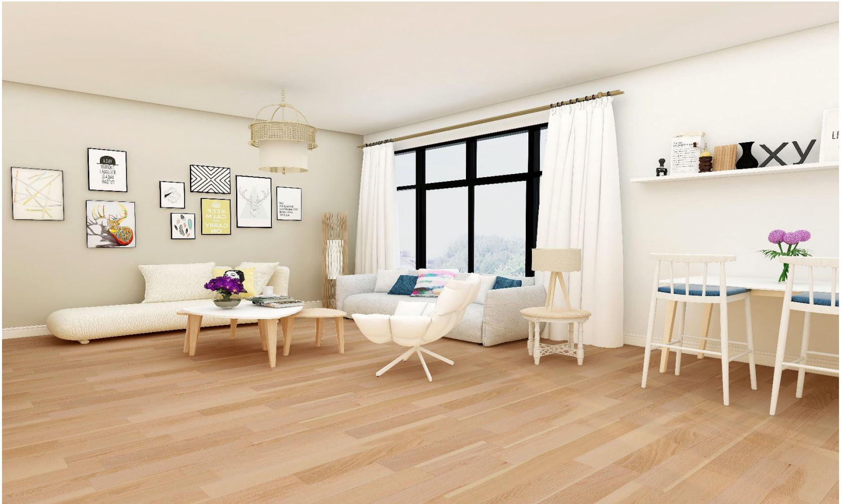
HIMALAYA OAK BLONDE BRUSHED | KLM-19-0052