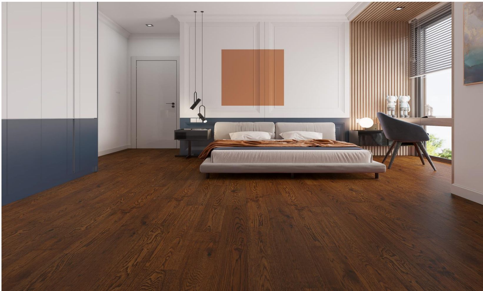
HIMALAYA OAK CAPUCCINO | KLM-19-0232