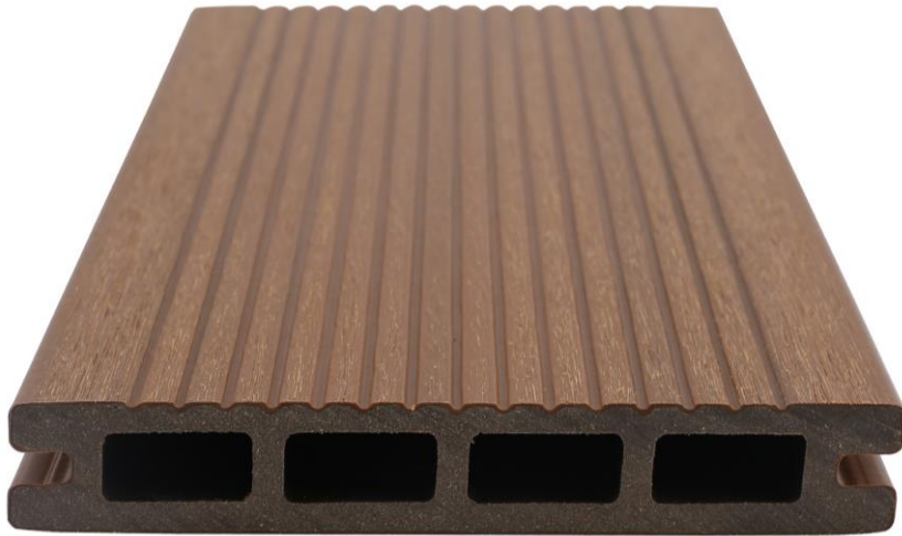
LADO A: RANURADO

PRODUCTO CUENTA CON PERFIL REVERSIBLE: UN LADO A, RANURADO ; UN LADO B, TIPO MADERA CEPILLADO