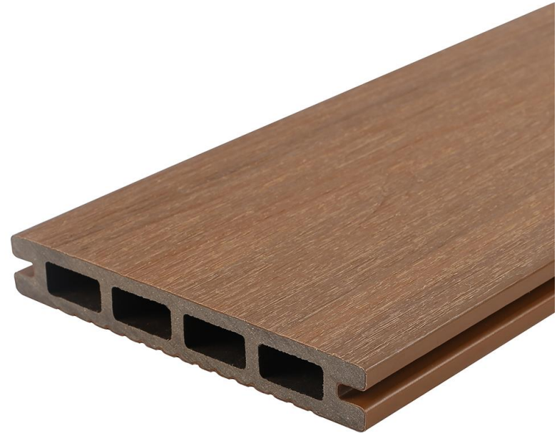
LADO B: TIPO MADERA CEPILLADO