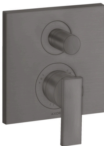
Ilustración del producto